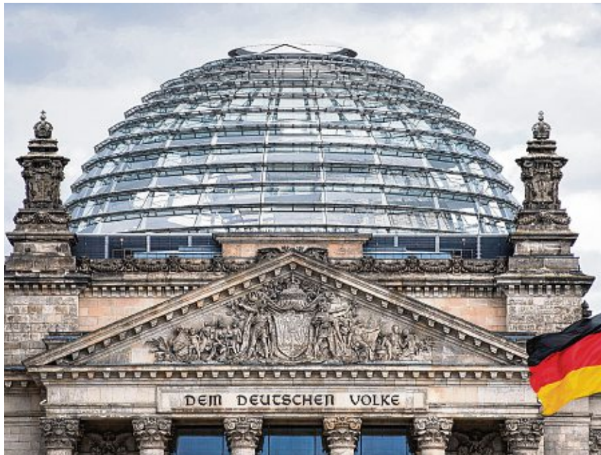
736 Abgeordnete sitzen im Deutschen Bundestag in Berlin, so viele wie nie ZUVOR.

Nach diesem Modell werden Überhang- und Ausgleichsmandate verhin-